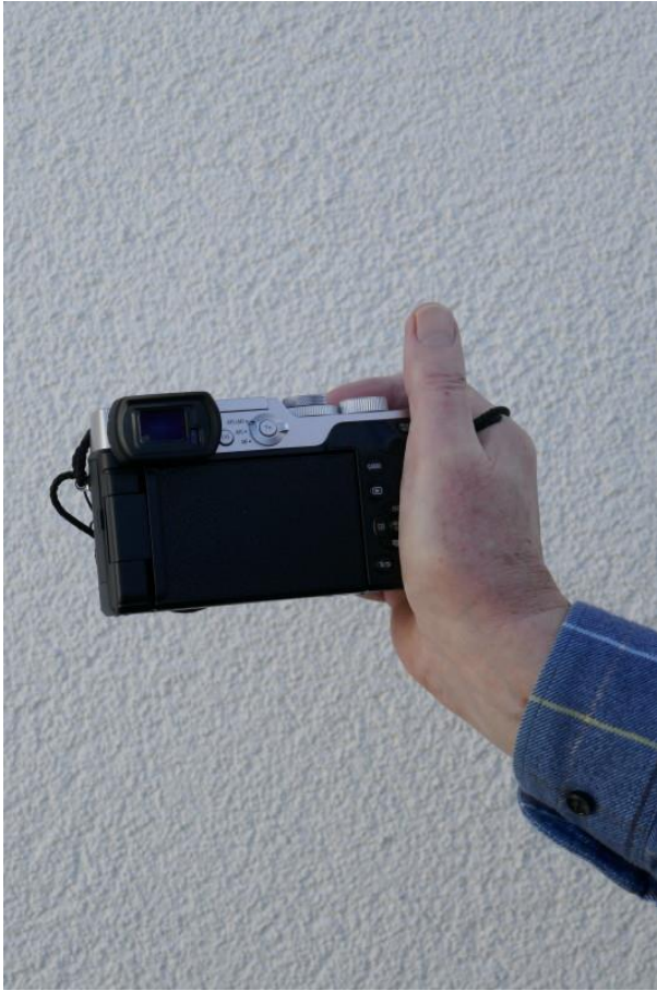
01 Ohne Schiene: Daumenballen unbeabsichtigt auf der Wippe