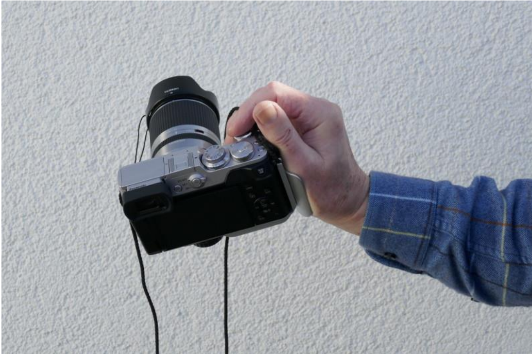
03 Zeigefinger auf dem Auslöser und am Stellring; drei Finger umschließen das Akkufach