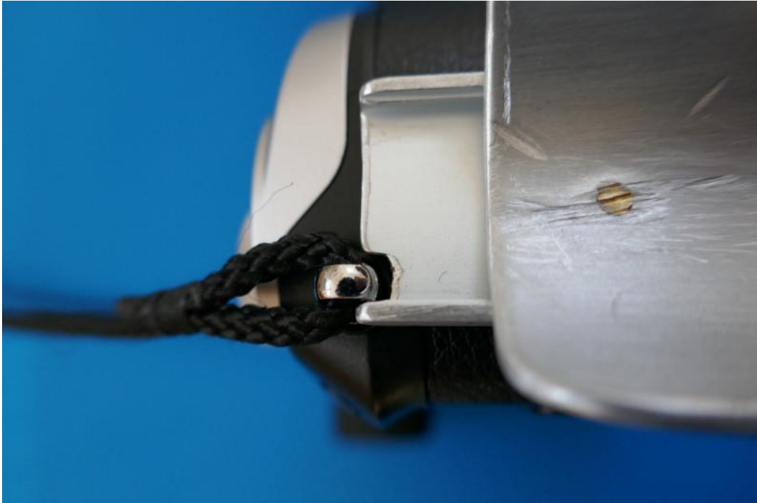
09 Detail: Ausnehmung des senkrechten Teils der Schiene an der Kamera-Öse