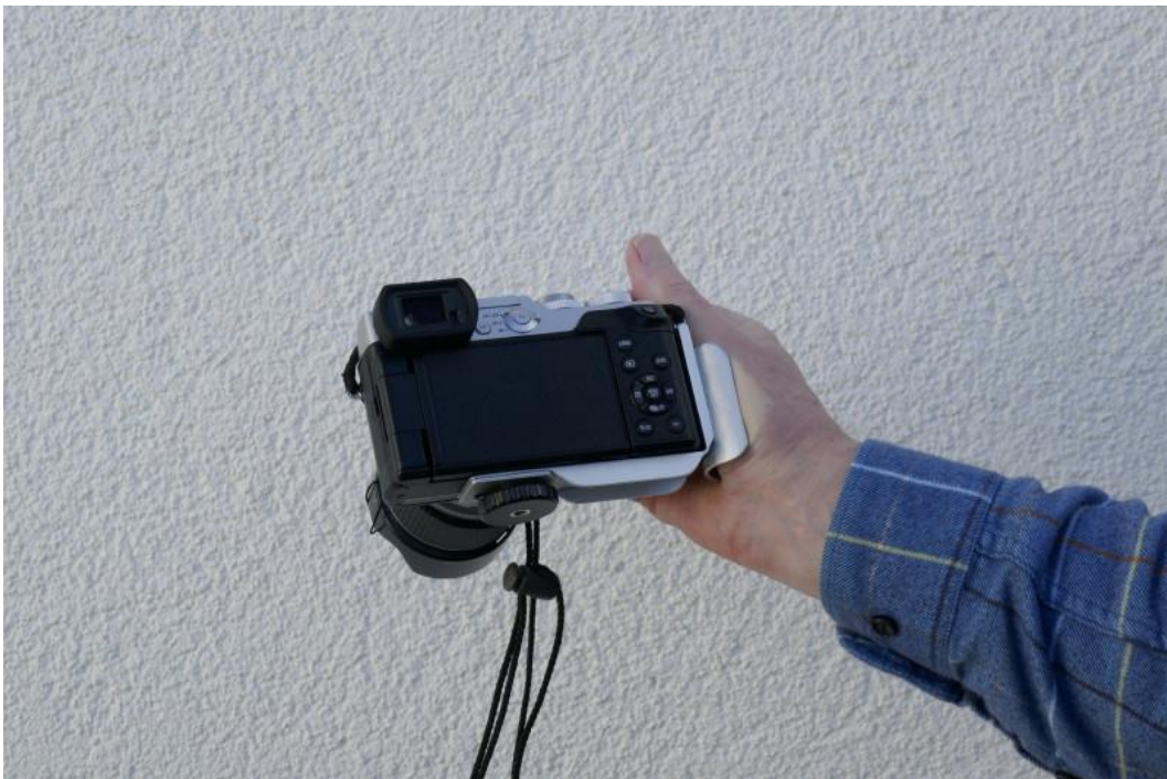
02 Mit Schiene: absolut sicherer und bequemer Halt