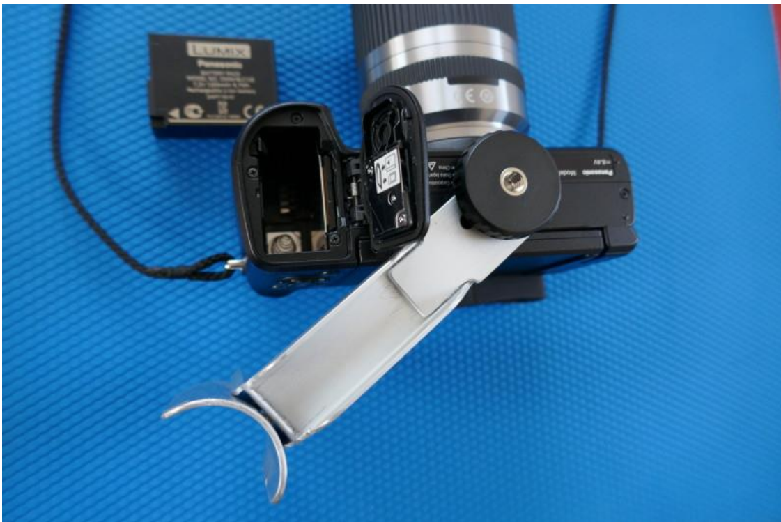
10 Schiene verschwenkt: Akkufach liegt frei. (Die Stativschraube braucht nur ½ Drehung gelockert zu werden.)