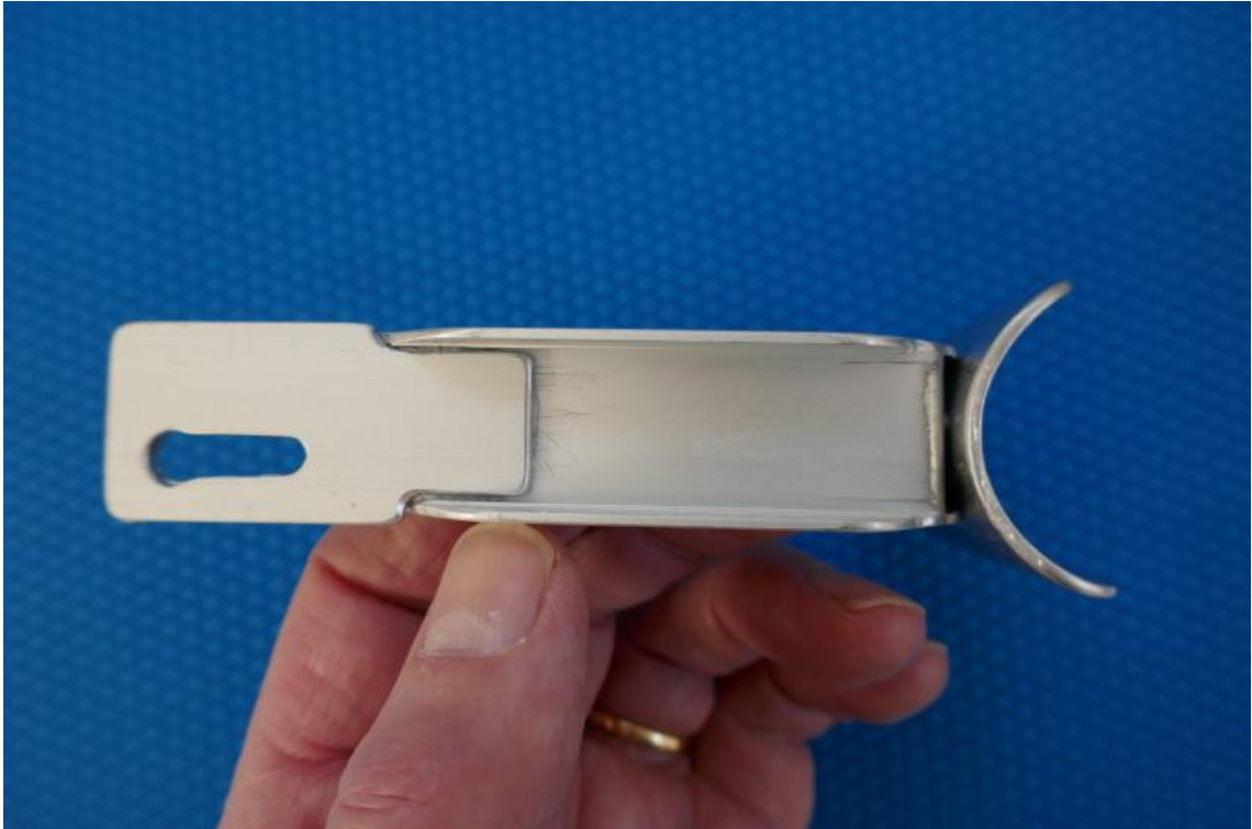
05 Schiene: Untersicht