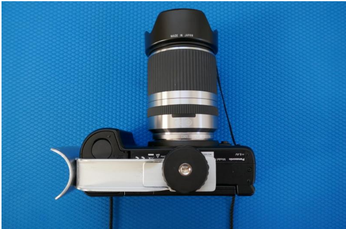
07 Kamera mit Schiene: Untersicht