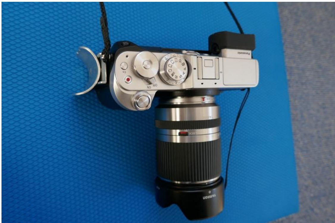
08 Kamera mit Schiene: Draufsicht